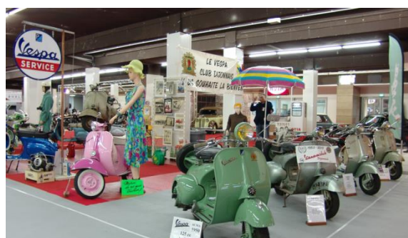
Vue du stand au salon 2016